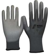
6205 Kod koloru: 1200