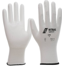
6200 Kod koloru: 1100