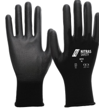
6215 Kod koloru: 1000