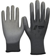
6205 Kod koloru: 1200