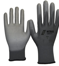
6205 Farbcode: 1200