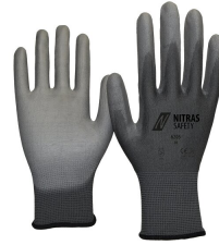
6205 Kod koloru: 1200