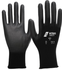
6215 Kod koloru: 1000