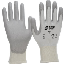
6305 // CUT C Kod koloru: 1112