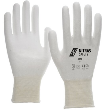
6300 // CUT C Kod koloru: 1100