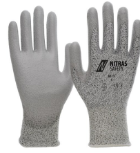
6315 // CUT C Kod koloru: 1200