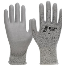
6315 // CUT C Kod koloru: 1200