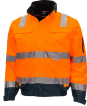
7140 // MOTION TEX VIZ PLUS Kod koloru: 4121