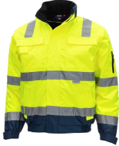
7141 // MOTION TEX VIZ PLUS Kod koloru: 4021