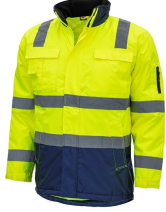
7145 // MOTION TEX VIZ Code couleur: 4021