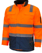
7144 // MOTION TEX VIZ Code couleur: 4121