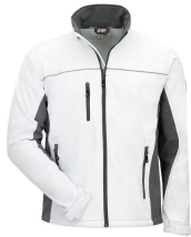
7153 // MOTION TEX LIGHT Code couleur: 1112