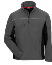
7152 // MOTION TEX LIGHT Code couleur: 1210