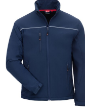
7151 // MOTION TEX LIGHT Code couleur: 2100