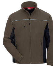
7157 // MOTION TEX LIGHT Code couleur: 5010