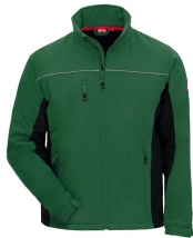
7154 // MOTION TEX LIGHT Code couleur: 3010