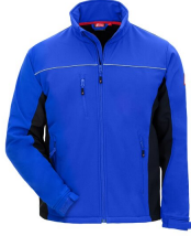
7156 // MOTION TEX LIGHT Code couleur: 2010