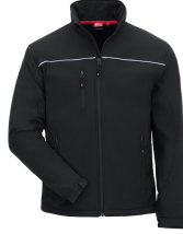
7150 // MOTION TEX LIGHT Code couleur: 1000