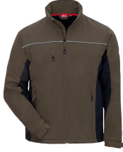
7157 // MOTION TEX LIGHT Code couleur: 5010