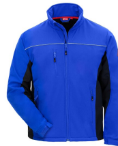
7156 // MOTION TEX LIGHT Code couleur: 2010