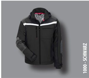
1000 - SCHWARZ