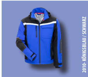
2010 - KÖNIGSBLAU / SCHWARZ