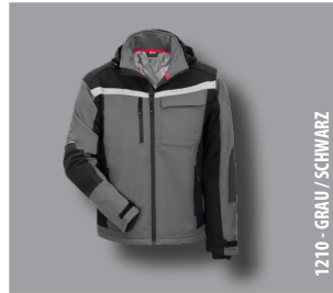
1210 - GRAU / SCHWARZ