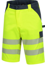
7570 // MOTION TEX VIZ Kod koloru: 4021