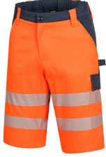
7570 // MOTION TEX VIZ Kod koloru: 4121